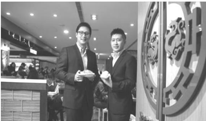
一家餐廳，只賣25道菜，擠身米其林餐廳

引進香港知名點心店「添好運」的兩位七年級創業家，除了貫徹原始店的SOP流程，更添加創意，打出外帶店、限定分店菜色等點子，成功鞏固品牌魅力。