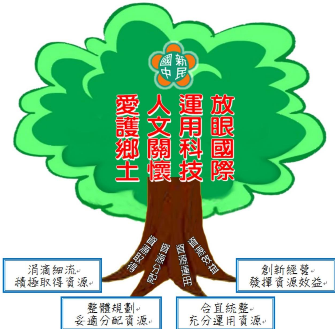
本校資源統整方案架構圖