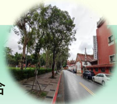
減法美學示意照片_大龍國小旁行人道