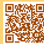
公教個人專戶制 宣導影片