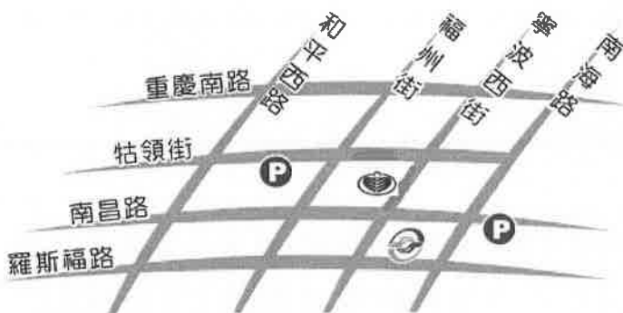
● 中華民國自閉症總會

《臺北場》中華民國自閉症總會附設星兒工坊（台北市中正區寧波西街 62 號 5 樓）