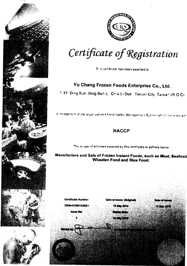
圖二、禹昌冷凍食品興業有限公司之 HACCP 證明