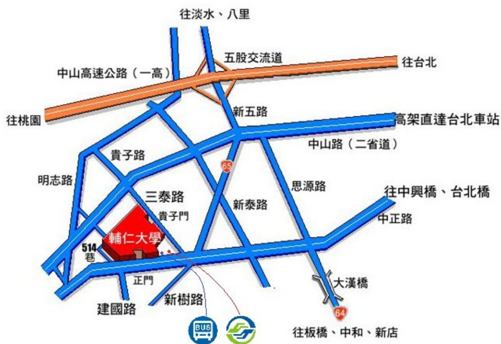
輔仁大學交通位置圖