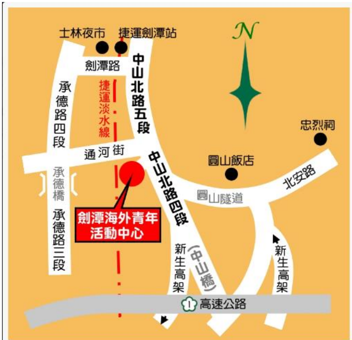
劍潭海外青年活動中心園區平面圖