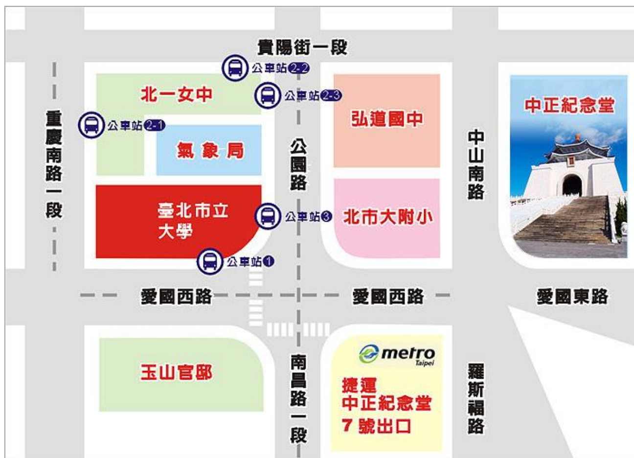
臺北市立大學（博愛校區）校園平面圖