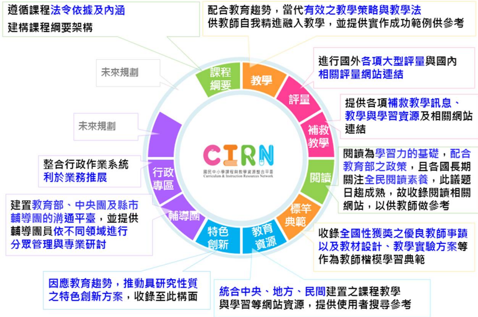
▲「國民中小學課程與教學資源整合平臺 CIRN」十大構面理念