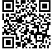
報名網站 QR CODE

◎【110相聲比賽專區】網址 http://app.stps.tp.edu.tw/crosstalk/