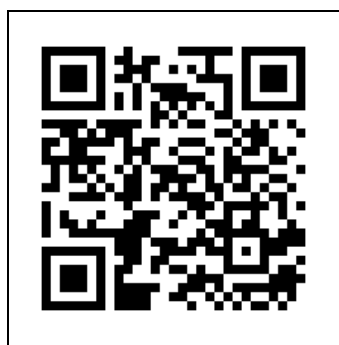
一般報名 QR code

https://forms.gle/KTgXh7vhninYcq39 )，即日起至 4 月 30 日下午五點以前完成報名（現場報名人數上限預定為 250 人）。